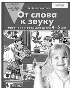
«От слова к звуку». Рабочая тетрадь для детей 4–5 лет