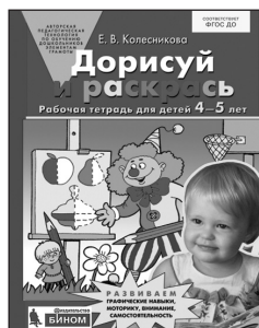
«Дорисуй и раскрась». Рабочая тетрадь для детей 4–5 лет