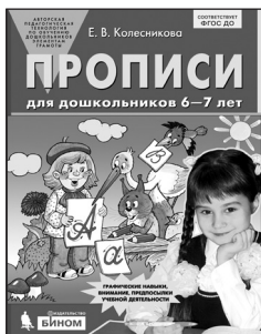
«Прописи для дошкольников 6–7 лет»