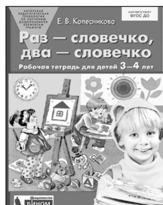
«Раз — словечко, два — словечко». Рабочая тетрадь для детей 3–4 лет