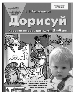
«Дорисуй». Рабочая тетрадь для детей 3–4 лет