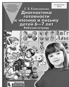
«Диагностика готовности к чтению и письму детей 6–7 лет». Рабочая тетрадь