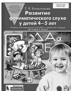
«Развитие фонематического слуха у детей 4–5 лет». Учебно-методическое пособие