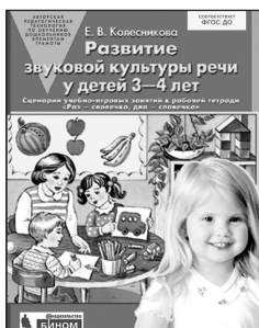
«Развитие звуковой культуры речи у детей 3–4 лет». Учебно-методическое пособие